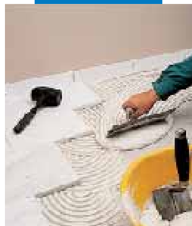
Posa di marmo bianco di Carrara con Granirapid bianco