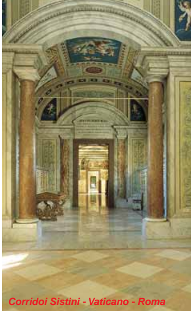
Corridoio Sistini - Vaticano - Roma