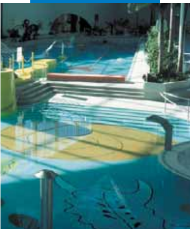
Esempio di posa di mosaico e klinker in piscina

Le referenze relative a questo prodotto sono disponibili su richiesta