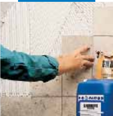
Posa di marmo Jura con Granirapid bianco