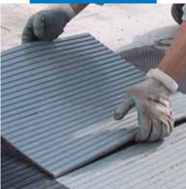
Posa di gomma attacco cemento con Granirapid

frabili ed esenti da grassi, oli, vernici, cere, ecc. I supporti cementizi non devono essere soggetti a ritiri successivi alla posa delle piastrelle e pertanto, in buona stagione, gli intonaci devono avere una maturazione di almeno 1 settimana per ogni centimetro di spessore ed i massetti cementizi devono avere una maturazione complessiva di almeno 28 giorni, a meno che non vengano realizzati con speciali leganti per massetti MAPEI come Mapecem , Mapecem Pronto , Topcem o con Topcem Pronto . Inumidire con acqua per raffreddare le superfici che risultassero troppo calde per l'esposizione ai raggi solari. I supporti di gesso ed i massetti in anidride devono essere perfettamente asciutti (umidità residua massima 0,5%), sufficientemente duri e privi di polvere e tassativamente trattati con Primer G o Mapeprim SP , mentre nelle zone soggette a forte umidità si deve primerizzare con Primer S .