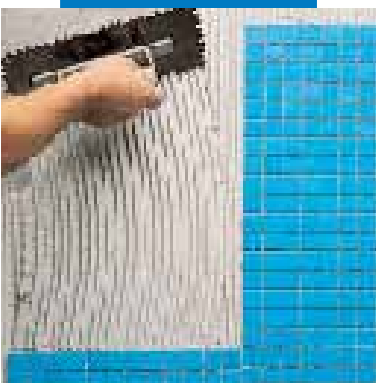
Posa di mosaico vetroso con Granirapid bianco