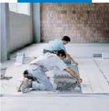
Posa di grès porcellanato in ambiente industriale