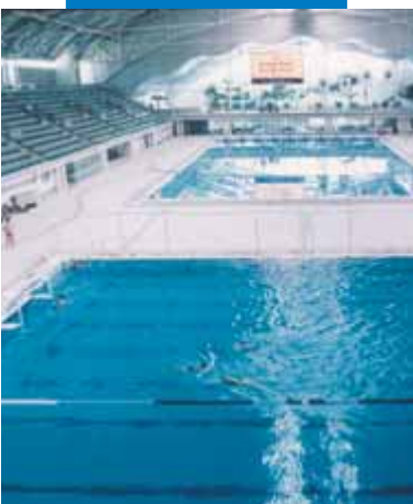
Esempio di posa di mosaico e klinker in piscina - Olympic Centre a Sydney (Australia)