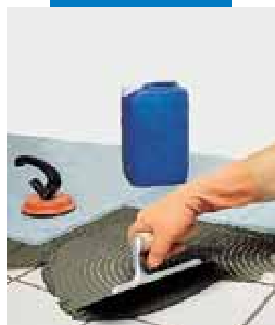
Sovrapposizione di agglomerato su ceramica esistente con Granirapid grigio