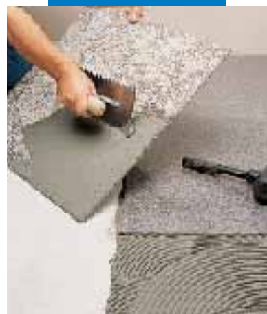
Posa di granito sintetico flessibile con Granirapid grigio